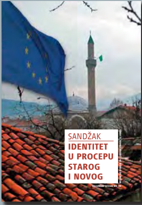
28. Sandžak: Identitet u procepu starog i novog