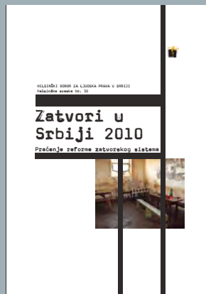
30. Zatvori u Srbiji 2010