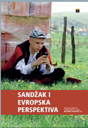
29. Sandžak i evropska perspektiva