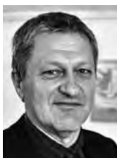
PIŠE: DRAGAN VELIKIĆ