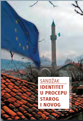
28. Sandžak: Identitet u procepu starog i novog