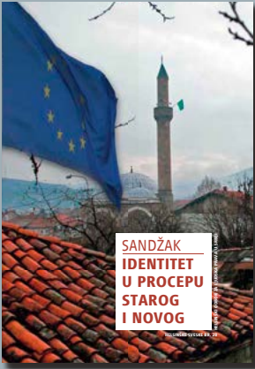
28. Sandžak: Identitet u procepu starog i novog