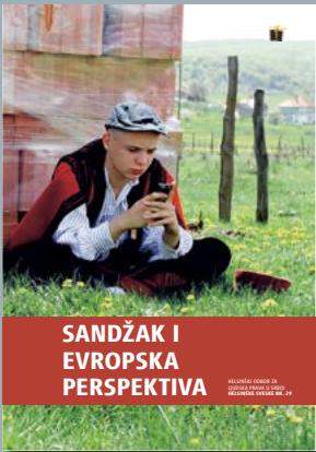
29. Sandžak i evropska perspektiva