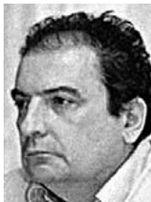
PIŠE: VLADIMIR GLIGOROV

Sporazumom koji su parafirali predsednici vlada Srbije i Kosova i koji bi trebalo da usvoje njihove skupštine okončava se opstrukcija Srbije suverenosti Kosova u skladu sa relevantnim odlukama Ujedinjenih nacija i mišljenjem Međunarodnog suda pravde. Mada se rešenja oko kojih je postignut sporazum ne razlikuju značajno od onih sadržanih u Ahtisarijevom planu, a koji je ugrađen u Ustav Kosova, razlika je u tome što se ne predviđa bilo kakvo nadgledanje nezavisnosti i suverenosti Kosova. Uz to, obe se strane obavezuju da jedna drugoj ne stvaraju smetnje u procesu integracije u Evropsku uniju, što znači da se Srbija obavezuje da više ne agituje protiv priznavanja Kosova od strane, inter alia, zemalja članica Evropske unije, a i podrazumeva se da će Srbija, verovatno kao konačni čin normalizacije, formalno priznati Kosovo kao nezavisnu državu, jer u suprotnom pristupanje Evropskoj uniji neće biti moguće. To je smisao 14. člana sporazuma gde se kaže da dve zemlje neće jedna drugoj stajati na putu evropskih integracija.